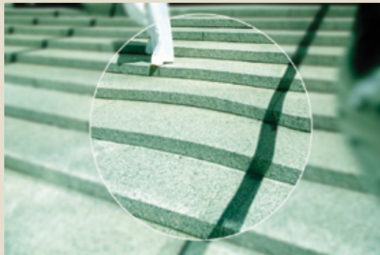
standaard multifocaal glas